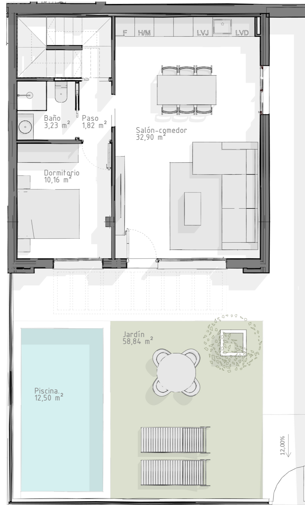
7.Viv. Unifamiliar. Planta baja