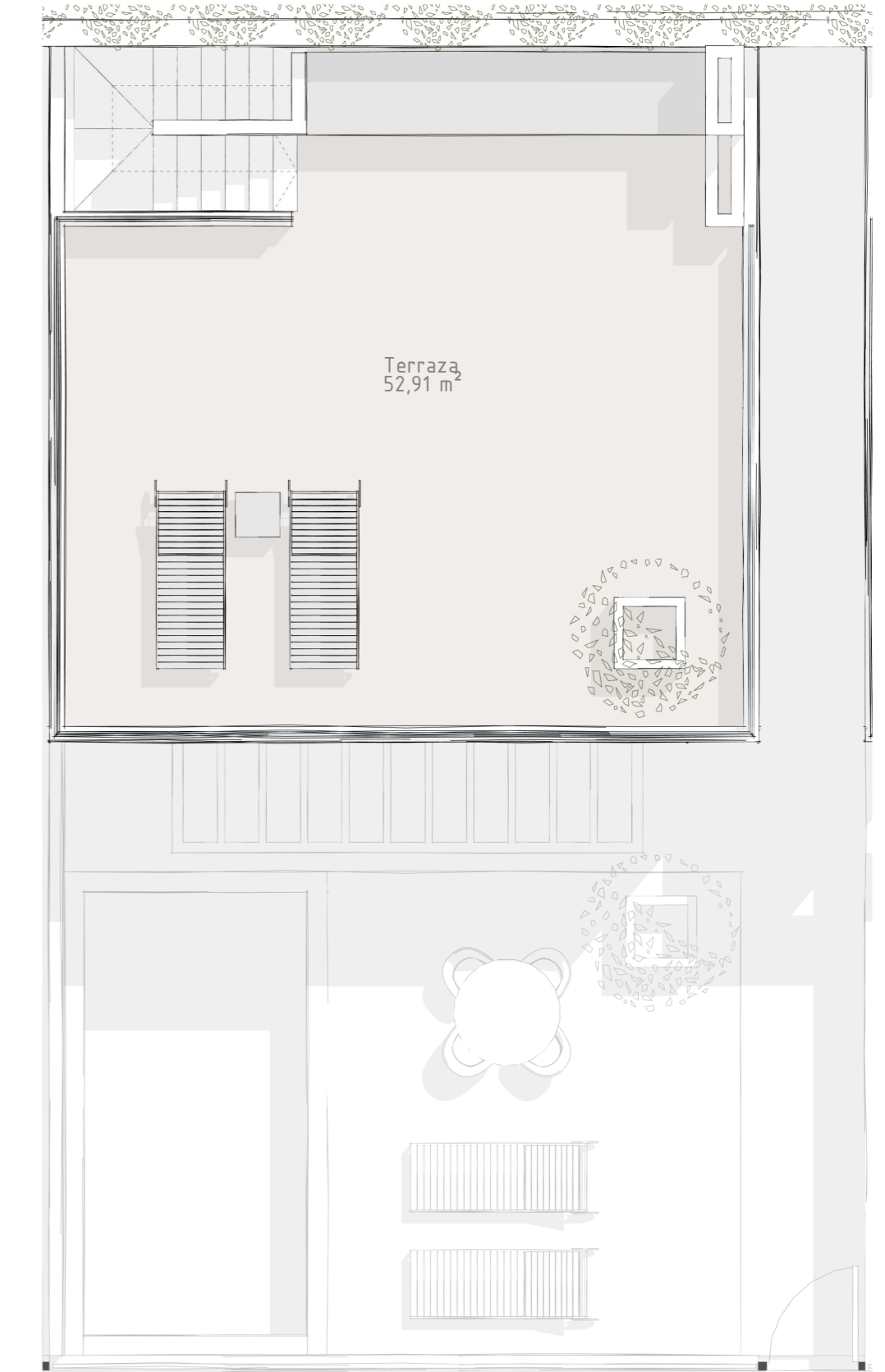
7.Viv. Unifamiliar. Terraza